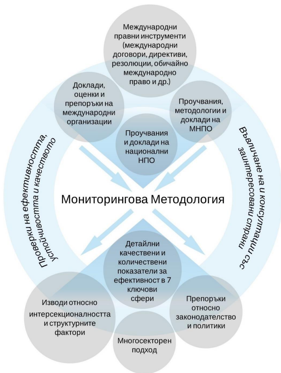
Фигура 1. Източници и очаквани резултати на методологията

Една от ключовите цели на мониторинговата методология, която в момента се разработва от Центъра и партньори, е да спомогне за идентифицирането на слабостите в съществуващата система за противодействие на ДННОП и да предложи конструктивни и базирани на доказателства насоки за преодоляването на тези предизвикателства.