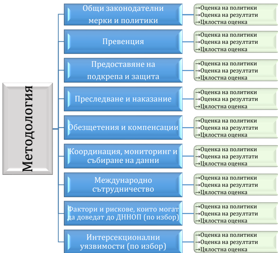
Фигура 2. Нива на анализ и тематични области